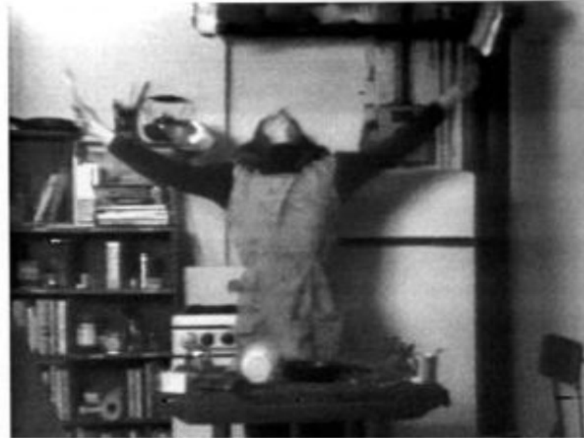
Martha Rosler (1975): Semiotics of the Kitchen