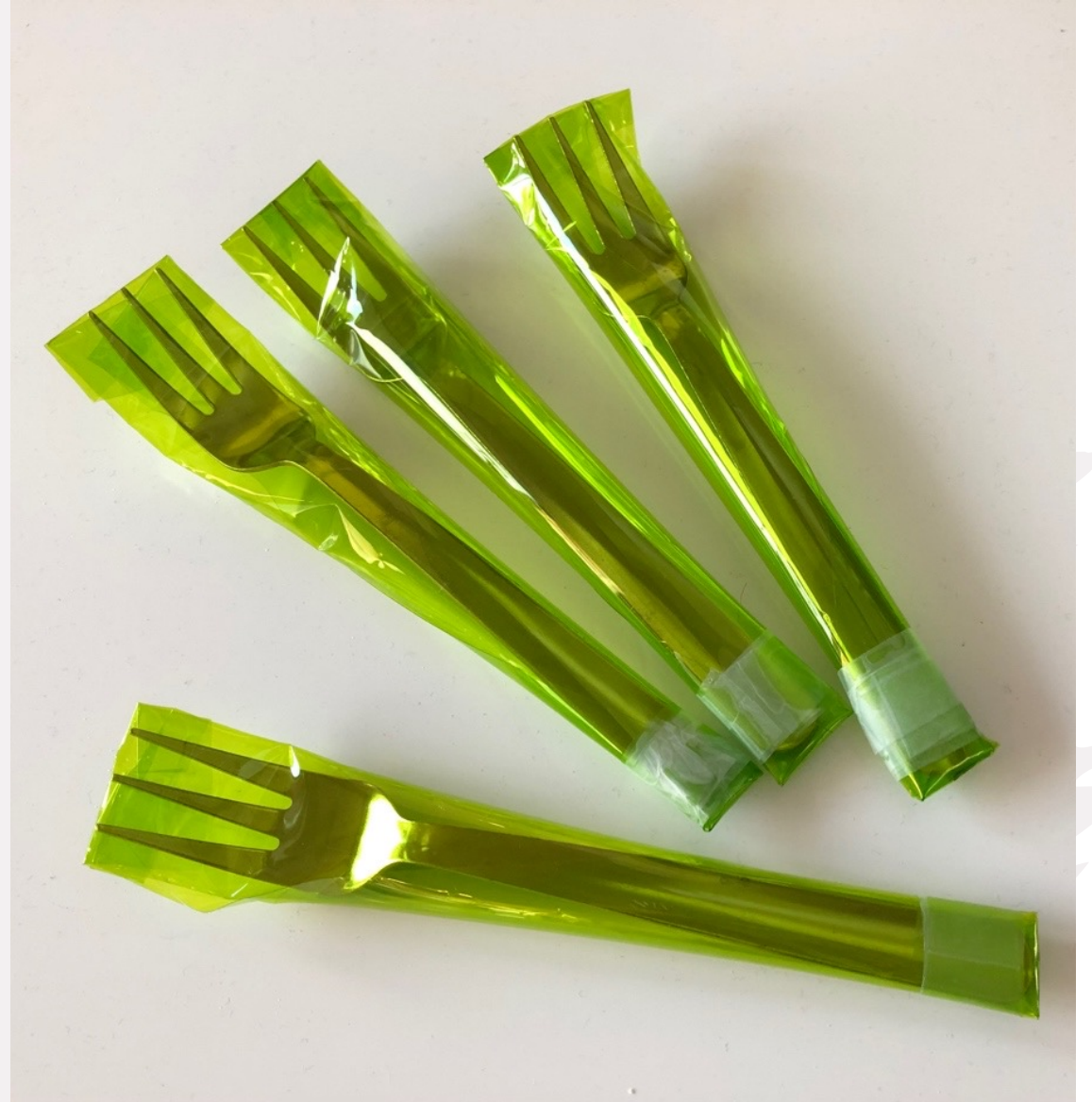
Haarukoita esityksestä.