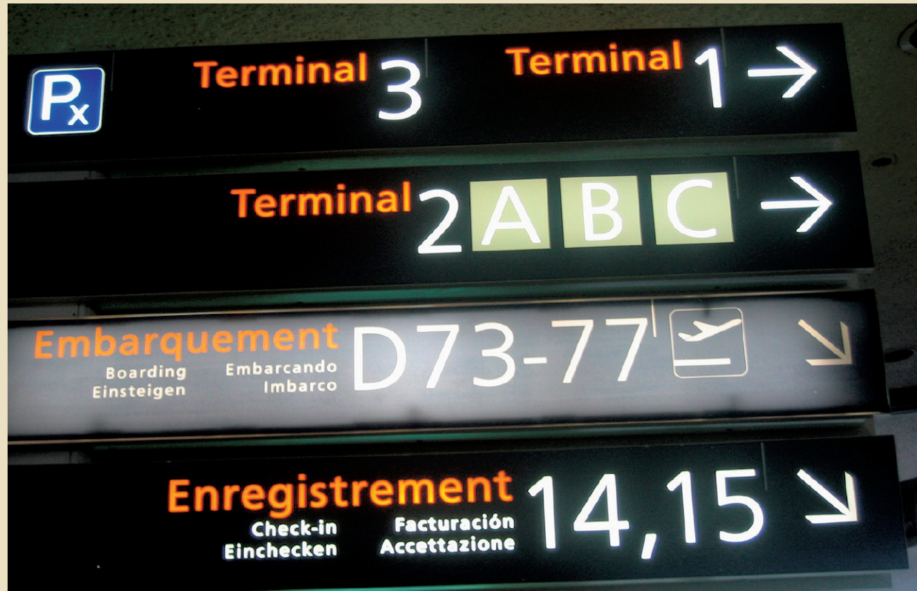
Seuraava sovellustapa, kuvattu 2004