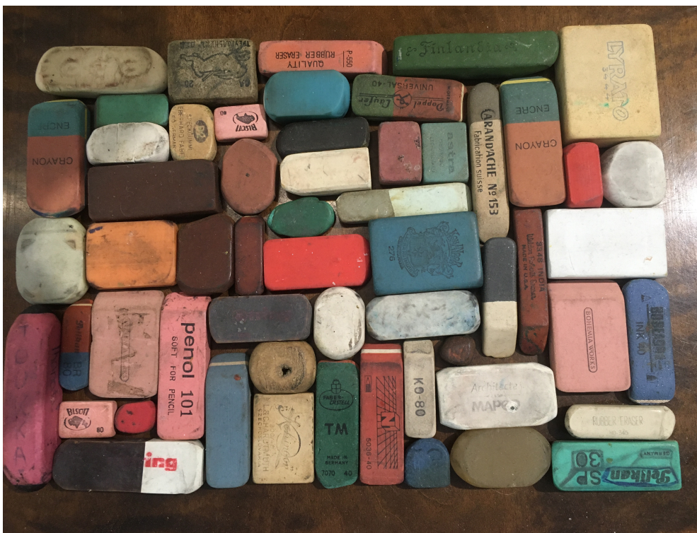
Kuva Anu Tuomisen näyttelystä Taidehallissa

Kirjallisia ja kuvallisia listoja tehdään molempia yhteensä kolme kappaletta.