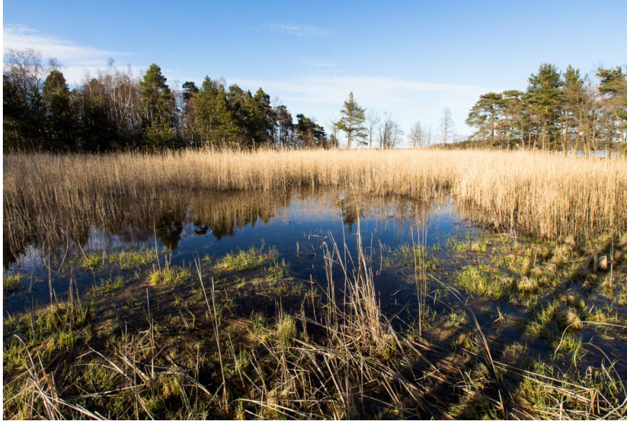
Uutelan luontomaisema / © Teemu Saloriutta, Citynature.eu https://www.myhelsinki.fi/en/see-and-do/nature/uutela-the-largest-and-most-diverse-outdoor-recreational-area-in-eastern-helsinki

Human-Non Human Interconnections in Art, Visual Culture & Everyday Life. Tentative Lesson Plan (January 12 th - April 6 th , 2022)