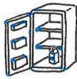
1. Maito on