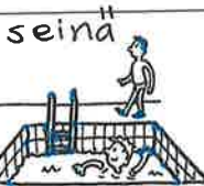
5. Mikko ui