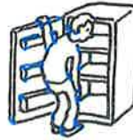
2. Isä on