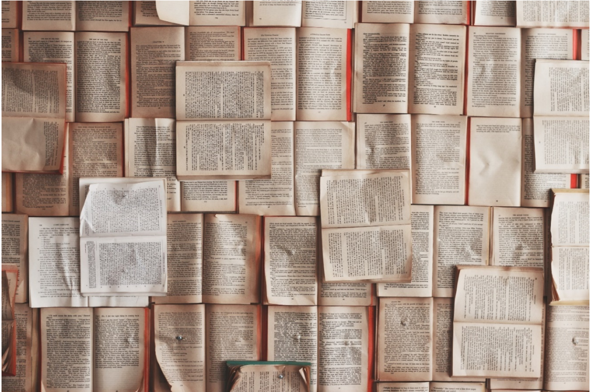
Kuva 3: Pyri erottamaan laadukkaat lähteet heikoista.

Informaatiota on saatavilla melkein rajattomasti, mutta yliopisto-opiskelijan keskeinen taito on erottaa hyvät lähteet heikkolaatuisista.