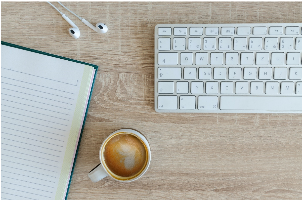
Kuva 1: Voit lisätä esseesi sen sanomaan liittyvää kuvitusta, älä kuitenkaan käytä kuvia vain kuvituksen vuoksi.