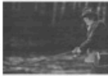
"Whistle of the fisherman"