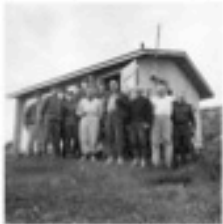
"PARTICIPANTS OF THE SAFARI"