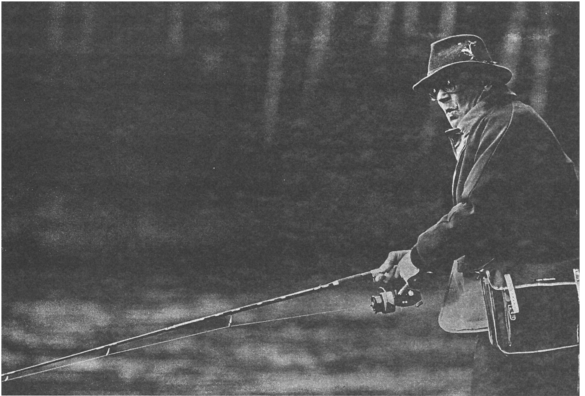
Kalamiehen vihellys. Pulskat taimenet vain odottavat arvovaltaista nappaajaansa, Blekingen Mörrum-joessa. Johto kalastusmaaottelussa on 3—1.