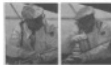
"President wanted to fight"