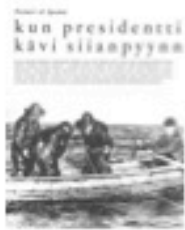
"The sea was slick"