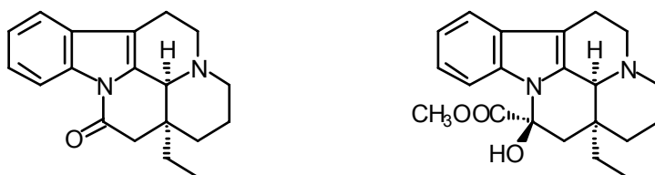
Kuva 2. (-)-Eburnamoniinin ja (+)-vinkamiinin rakenteet [2].

Molekyylin rakennekaavoissa käytetään tarkoituksenmukaista, vakiintunutta esitystapaa ja ne otsikoidaan kuvina, kuten kuvassa 2. Viittaus voidaan tehdä silloin näin: Kuvassa 2 on esitetty eburnamoniinin ja vinkamiinin rakenteet Lounasmaan ja Tolvasen [2] mukaan.