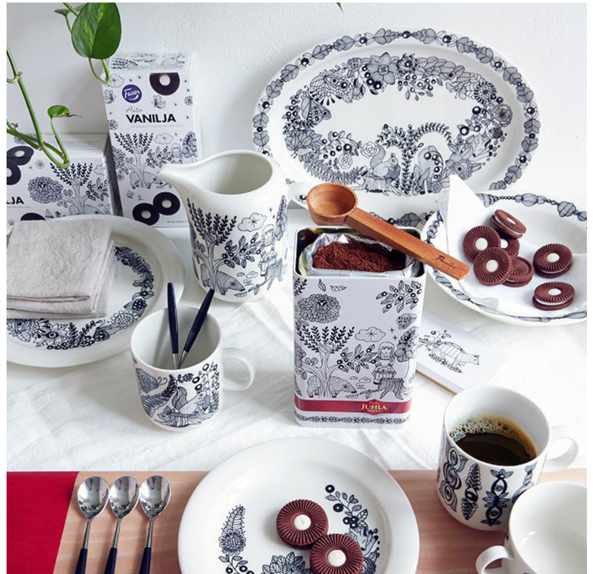
Piia Kedon Piilopaikka, Arabia