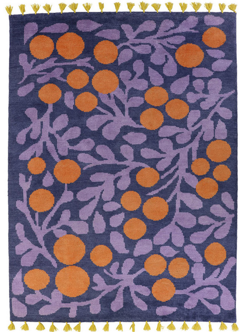
Eri Shimatsukan Terttu, Finarte