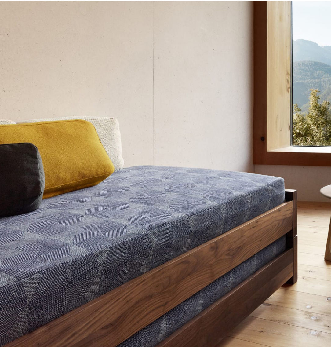
Akira Minagawan kudottu Crystal Field, Kvadrat

Kuosin skaalan pitää toimia suhteessa huonekalun kokoon. Usein kudottuja kankaita. Myös rotaatiopainettuja ja tekstiilitulostettuja.