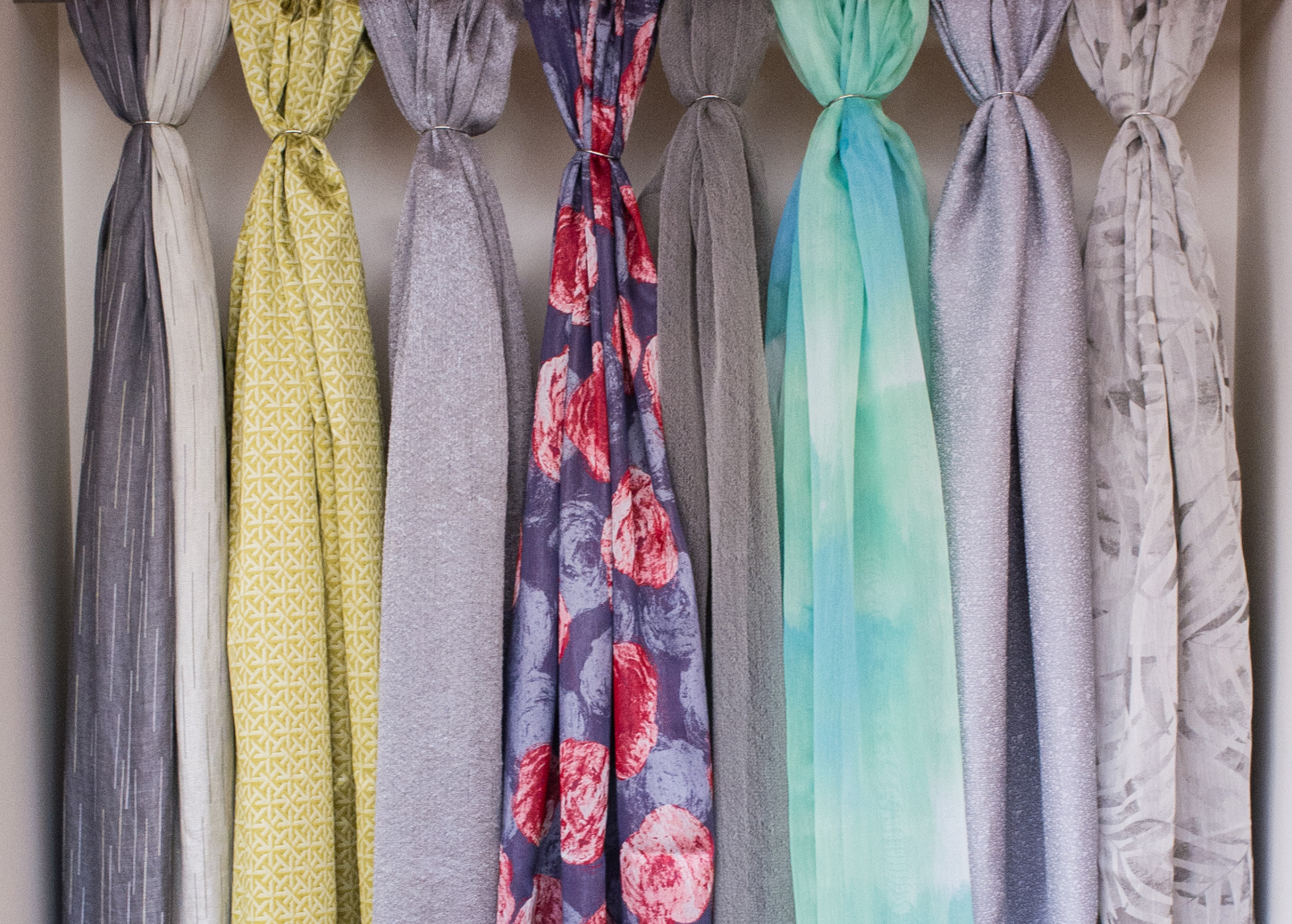
Petra Haikosen verho kangasmalleja, Lodetex