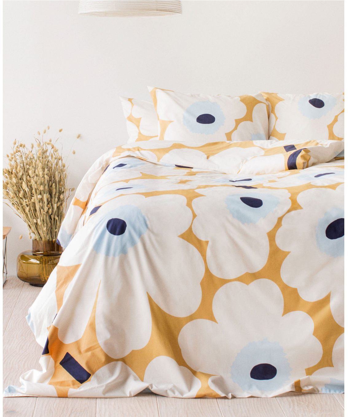
Maija Isolan Unikko, Marimekko

Usein rotaatiopainettuja/ tekstiilitulostettuja.