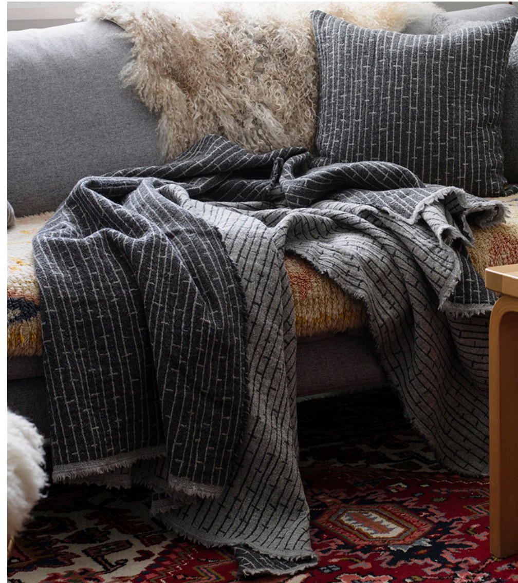
Tong Renin kudottu Metsä, Lapuan Kankurit