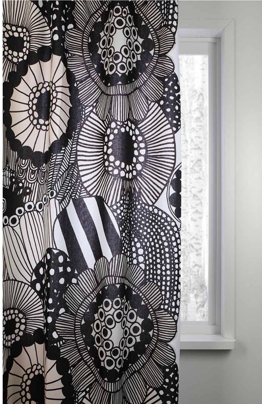
Maija Louekarin Siirtolapuutarha (raportin korkeus 116cm), Marimekko

Kuviot voivat olla suuriakin, koska verhojen pinta-ala on iso.