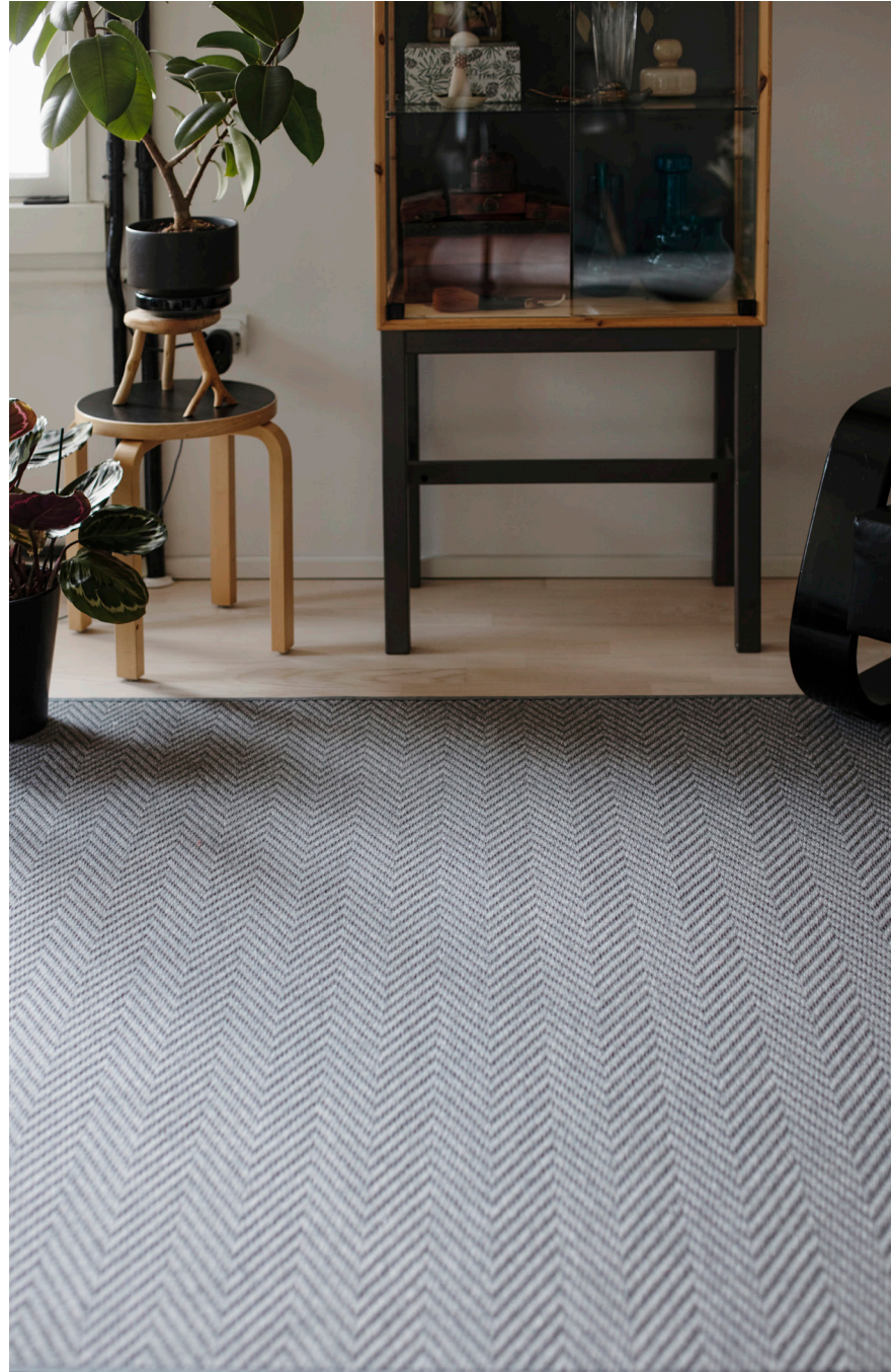
Elsa-matto, VM Carpet

Valmistetaan yleensä kutomalla, usein varsipuilla, mutta myös jacquardina. Nukitettuja mattoja tehdään monilla eri kudontatekniikoilla ja käsin solmimallakin. Myös painettuja kuvioita matoissa näkee.