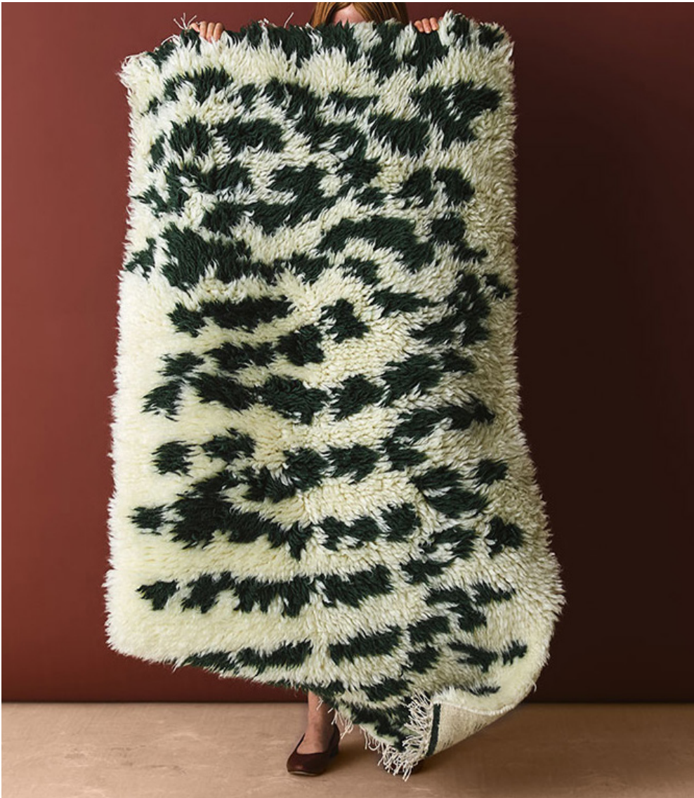
Studio Smoon Hilla, Finarte

Valmistetaan yleensä kutomalla, usein varsipuilla, mutta myös jacquardina. Nukitettuja mattoja tehdään monilla eri kudontatekniikoilla ja käsin solmimallakin. Myös painettuja kuvioita matoissa näkee.