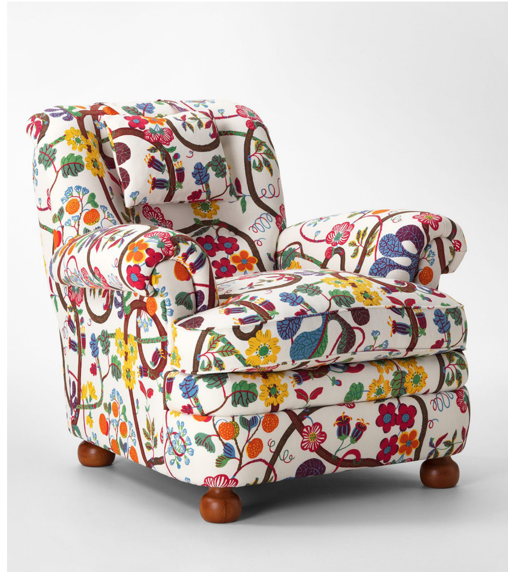
Josef Frankin painettu Armchair 336, Svenskt Tenn