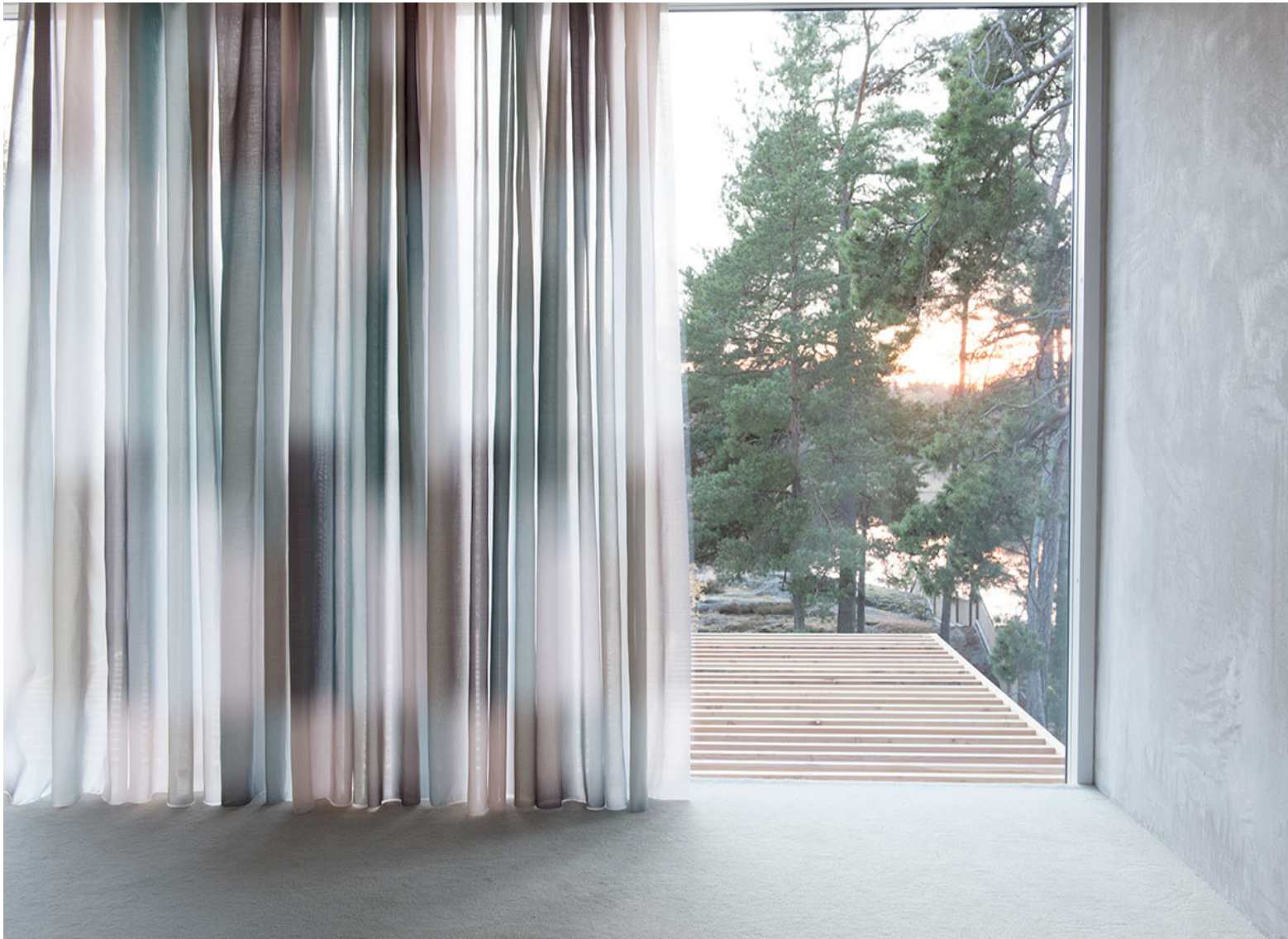
Aoi Yoshisawan tekstiilitulostettu Moments, Svensson

Verhokankaat ovat yleensä ohuita. Tämä vaikuttaa suunnitteluun esimerkiksi kudottujen kankaiden sidoksia ja materiaaleja valittaessa. Verhot myös näkyvät kahteen suuntaan - sekä sisälle tilaan että ulos.