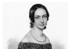
Clara Schumann 1819 - 1896