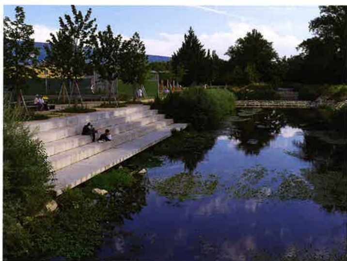
...the River ...erland ...p. 8.