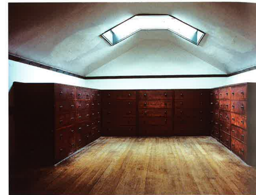
Keskusperheen asunon ullakko, Shaker-kylä Pleasant Hill, Kentucky, 1800-luvun alku. Attic of the Centre Family Dwelling, Pleasant Hill Shaker village, Kentucky, early 19th century.

Aire-joen luonnollistamisessa topografia ja istutettu kasvillisuus olivat hydraulisen hallinnan päämenetelmät, mutta