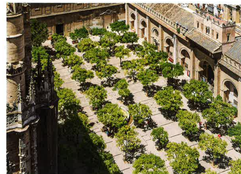
Sevillian appelsiinipiha, Espanja, 800-luku. Patio of the Oranges, Seville, Spain, 9th century.

It seems to me that the challenge to landscape architecture today is not only to achieve peace with planetary systems, but also to elevate pragmatic demands to the level of poetics – that is, to treat as if poetry, what first appears to be prose. In his own declaration made forty years ago, the sculptor Claes Oldenburg phrased it this way: "I am for an art that embroils itself with the everyday crap