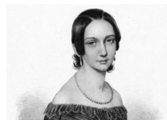
Clara Schumann 1819 - 1896