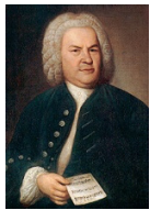
Johann Sebastian Bach

Von wann bis wann haben sie gelebt? Wann sind sie geboren / gestorben?