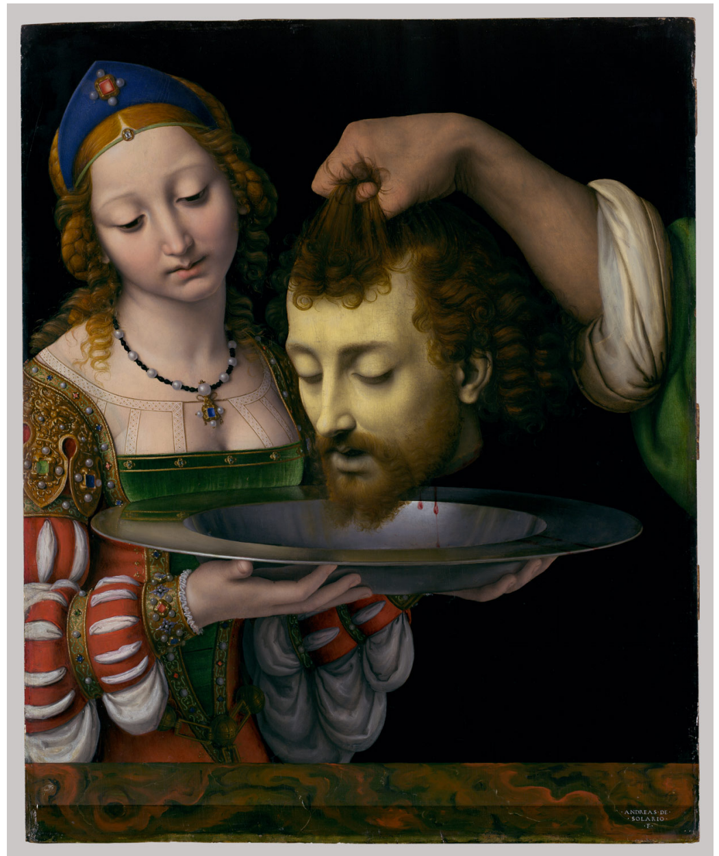
Salome with the head of St. John the Baptist. Andrea Solario, 1465-1524.