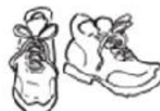
talvikengät; lenkkarit = jogging shoes