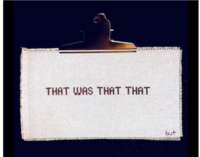
Bild: Brodera ut texten