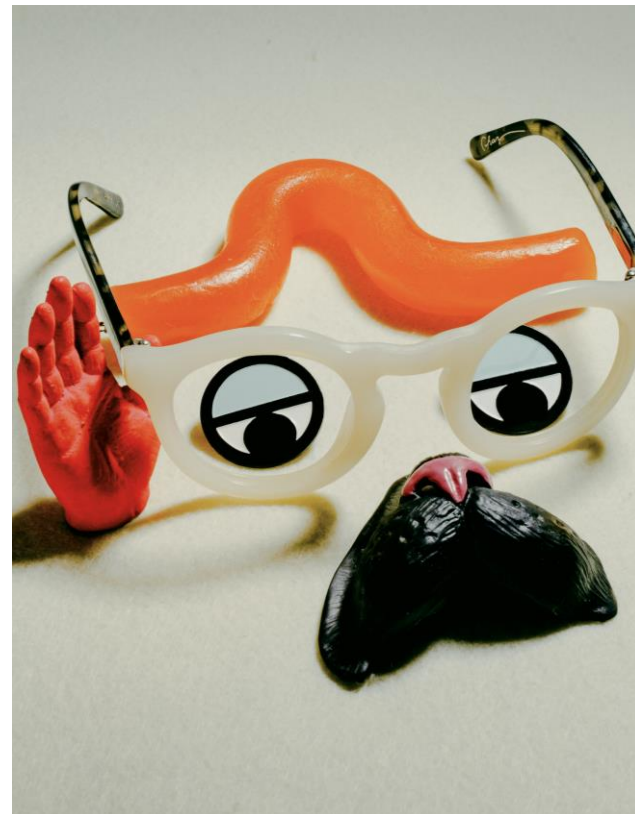
Girl with red hat

12 minuter – sedan berättar ni 3 intressanta saker om varandra för gruppen!