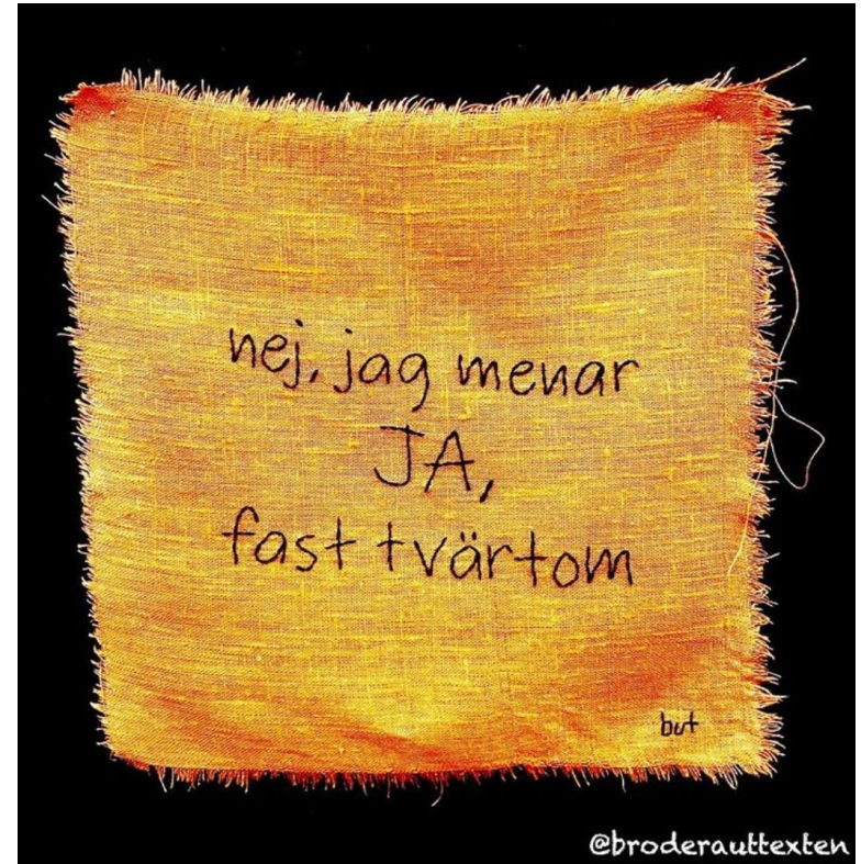
Bild: Brodera ut texten

Diskutera ca 12 minuter. Var beredda att berätta om minst 1+1 konkreta saker.