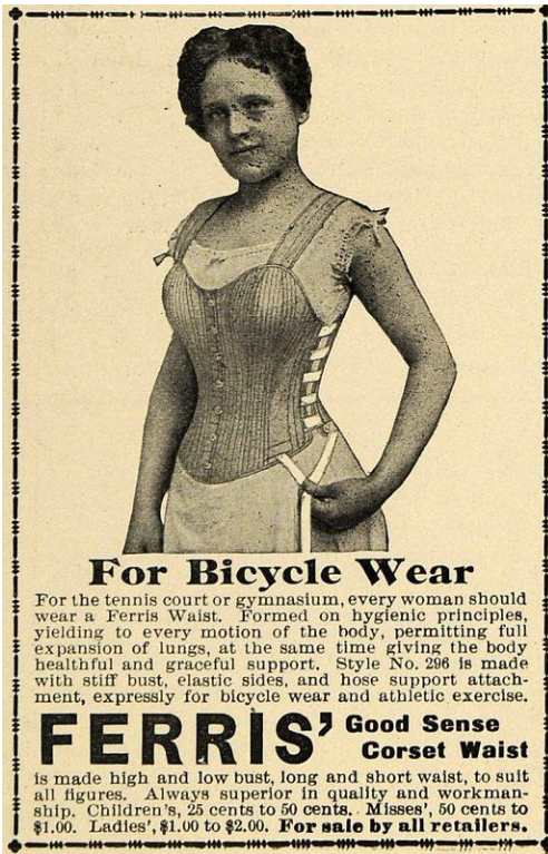
Kuva 1: Joustokorsettimainos vuodelta 1897.