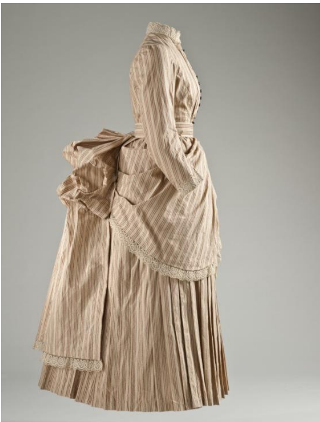
Kuva 7: Puuvillainen tennismekko vuodelta 1885. (Lacma)

Muotihistorioitsija C. Willett Cunningtonin mukaan, vuoteen 1884 tultaessa naisten urheiluvaatetus - tennisvaatetus mukaan lukien - alkoi muodostaa oman erillisen muoti-ilmiön naisten päiväpukeutumisessa (Matthews, 2016). 1800-luvun lopulla lehdet mainostivatkin tyylikkää tennismekkoja, jotka oli valmistettu villasta, silkistä, satiinista ja raidallisesta flanellista. Hameet olivat suoria ja laskostettuja, helmojen pituuden ollen 5–10 cm maasta (Matthews, 2016).