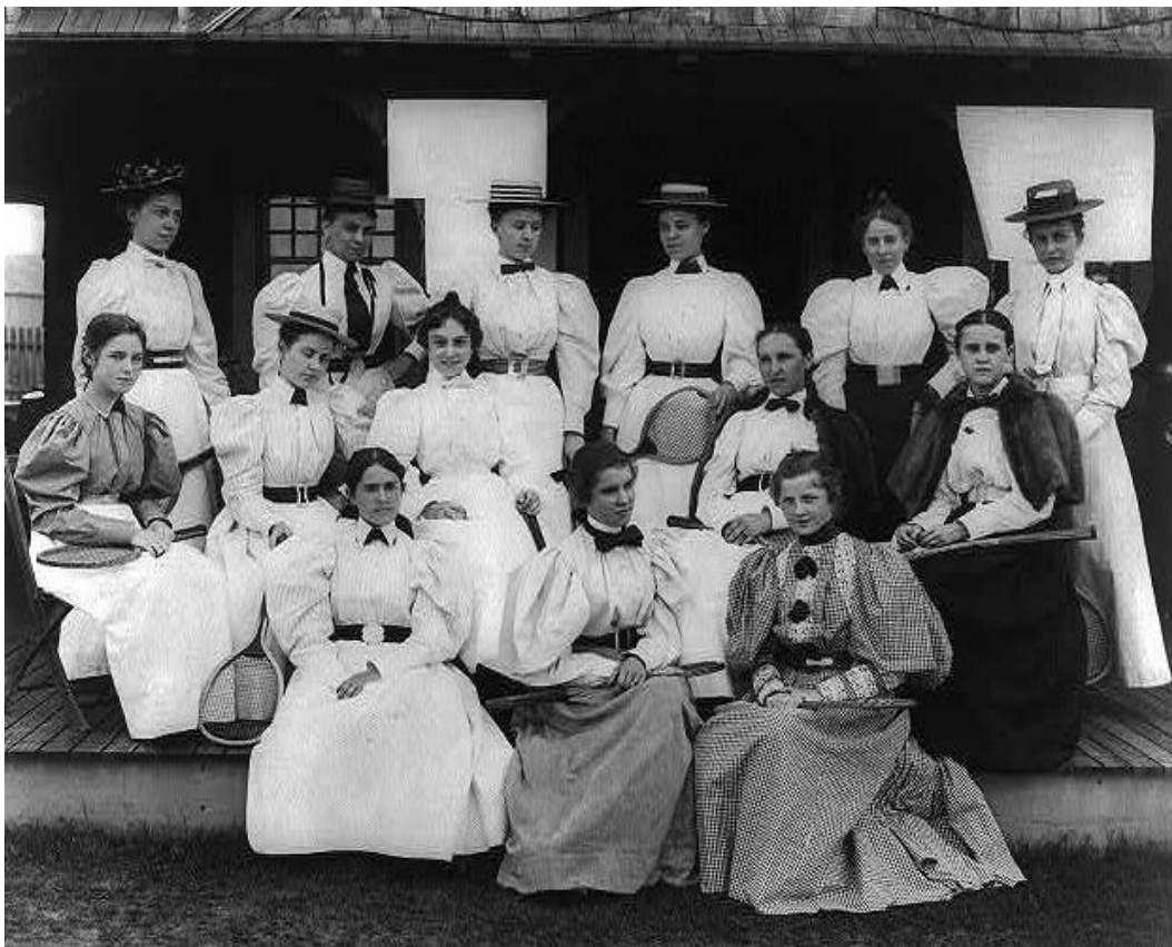
Kuva 10: Amerikkalaisia kansainvälisen tason tennispelaajia vuonna 1895.