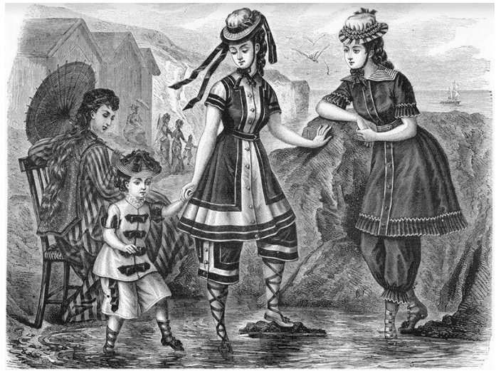
Kuva 13: Uimapukumuotia 1800-luvun lopulta. Takana näkyy myös uimahuoneita. (Sleuth)