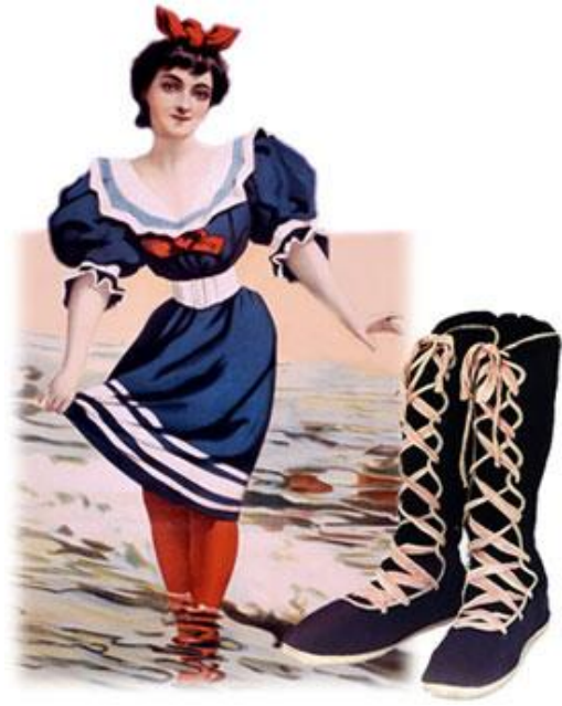
Kuva 18: Rantatossut ja uimapukumuotia 1800-luvun lopulta.