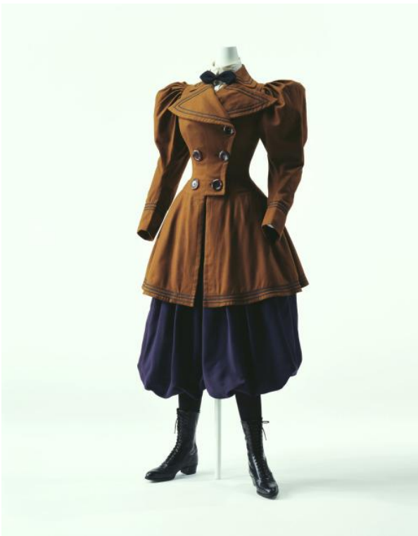
Kuva 3: Pyöräilyasukokonaisuus vuodelta 1895, USA.