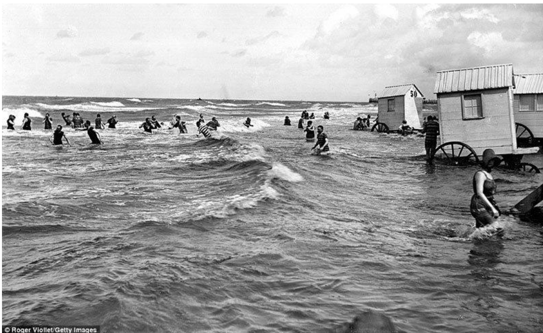
Kuva 11: Hevosella vedettäviä uimahuoneita.

Pukeutumisetiketin lisäksi naisten yleisiä säädyllisyysvaatimuksia noudatettiin tarkasti, etenkin rannalla. Naisten retket rannalle oli suositeltu suoritettavan ehdottomassa yksityisyydessä, miesten ei suotu näkevän naista märässä uimapuvussa. Merenrantakohteissa rantavesi oli niin matalaa, etteivät naiset voineet käydä kylpemässä meressä suoraan rannalta käsin. Niinpä tarkoitukseen kehitettiin erityisiä pyörillä kulkevia "uimahuoneita" (eng. the bathing machine ), jotka vedettiin hevosella syvemmälle veteen, jotta naisten kylpyhetkestä tulisi mahdollisimman intiimi toimitus. Näin estettiin veteen laskeutuvan ja vedestä nousevan naisen altistuminen miesten katseille. Uimahuone toimi samalla myös naisten pukuhuoneena. Myöhemmin 1900-luvulle tultaessa naisille kehitettiin uimahuoneiden sijaan käytännöllisempiä pukeutumisteltoja (kuva 12), joihin nainen pystyi pukeutumaan (CNN, 2021). Telttaa oli helpompi ja kevyempi kuljettaa rannalla ja nainen saattoi teltan suojassa vaihtaa merikylvyn jälkeen uimavaatteensa kuiviin. Märät vaatteet olisivat paljastaneet vartalon muotoja liikaa. Joissain 1800-luvun kuvissa näkee naisia kylpemässä myös pelkkä pukeutumisteltoa tai erityinen kylpyteltoa yllään.