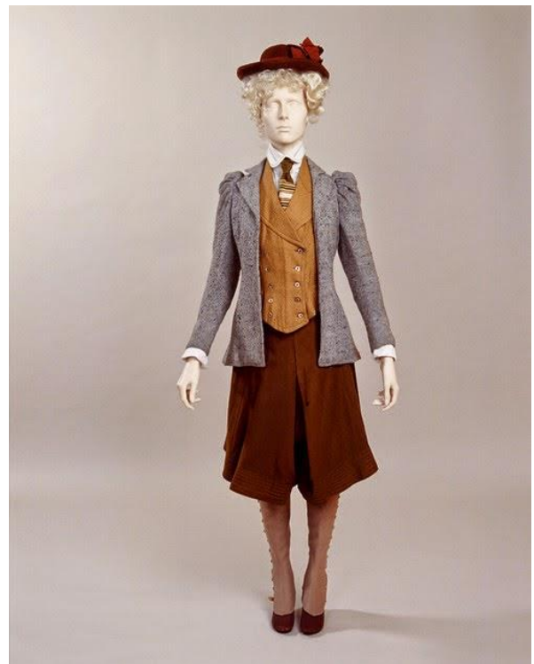
Kuva 6: Pyöräilyasukokonaisuus vuodelta 1895