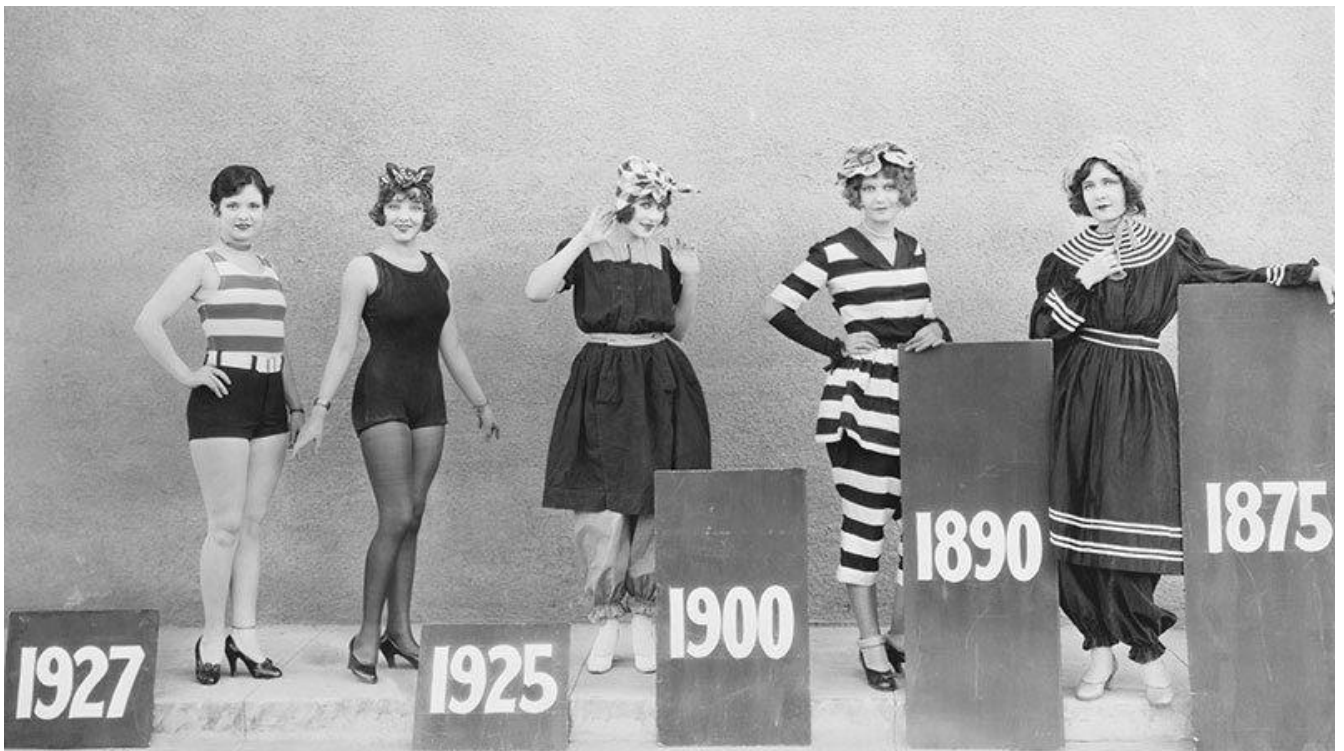
Kuva 14: Uimapukumuotia 1800-1900-lukujen taitteesta.