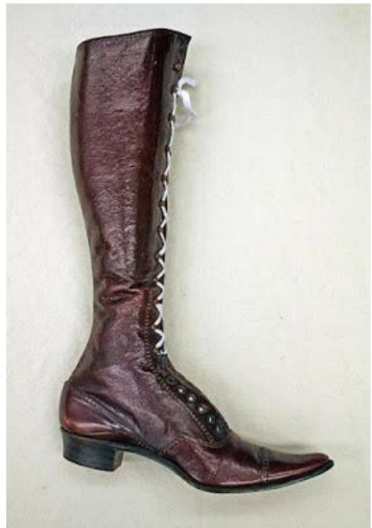
Kuva 4: Pyöräilykenkä, 1895-1900-luvulta.