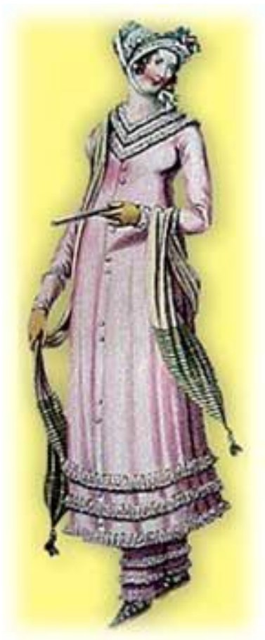
Kuva 15: Uimapuku 1810-luvulta. (La Belle Assemblée Fashions, 1810)

Kuten edellisestä kuvasta voi päätellä (kuva 14), naisten 1800-luvun lopun uimapuvut olivat hyvin peittäviä. 1800-luvun alussa uimapukuun kuuluivat vielä hansikkaat, jotka vuosisadan puolessa välissä saattoi jo jättää pois. 1800-luvun alun uimapuku muodostui pitkästä mekosta ja pitkistä housuista (kuva 15). Mekon helmaan naiset ompelivat painoja, etteivät jalat paljastuisi veteen mennessä, helmojen noustessa kellumaan (Victoriana Magazine, s.a.). Bloomers-housut olivat ensin pitkät, lisäksi säärtä peitivät myös joko pitkät sukat, tai varrelliset rantatossut.