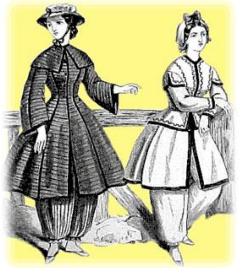
Kuva 16: Uimapukuja 1860-luvulta. (Godey's Lady's Book, 1864)