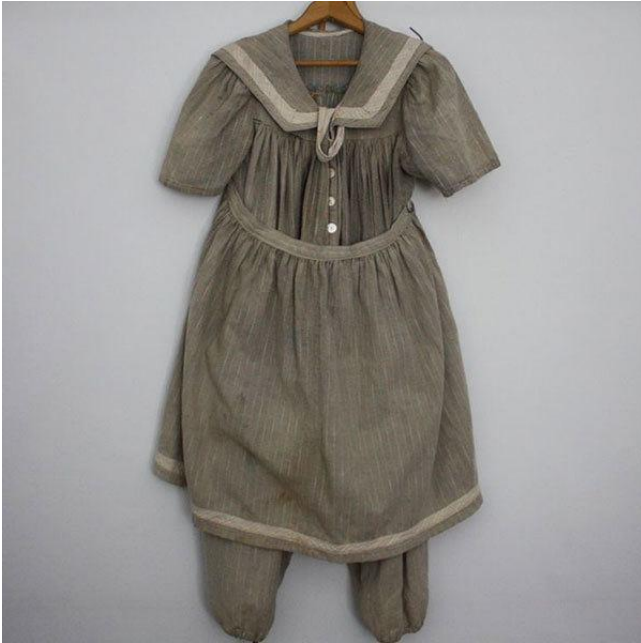
Kuva 17: Uimapuku 1800-luvun lopulta.