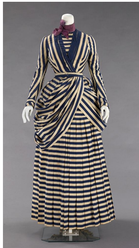
Kuva 8: Tennismekko vuodelta 1885–1888. (Met Museo)