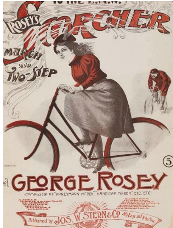
Kuva 2: Mainos musikaalista The Scorchers , 1890-luku.