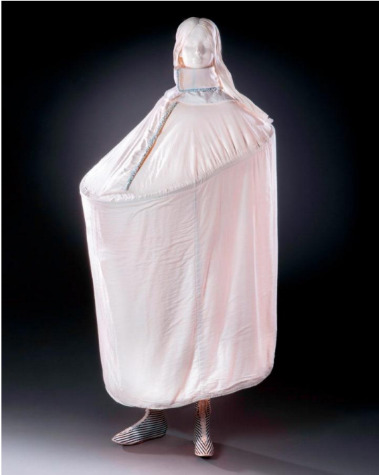
Kuva 12: 1900-luvun alun pukeutumisteltoa.