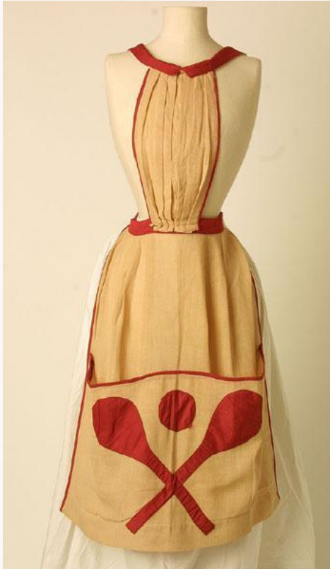
Kuva 8: Puuvillainen tennisesiliina v.1880-1900.