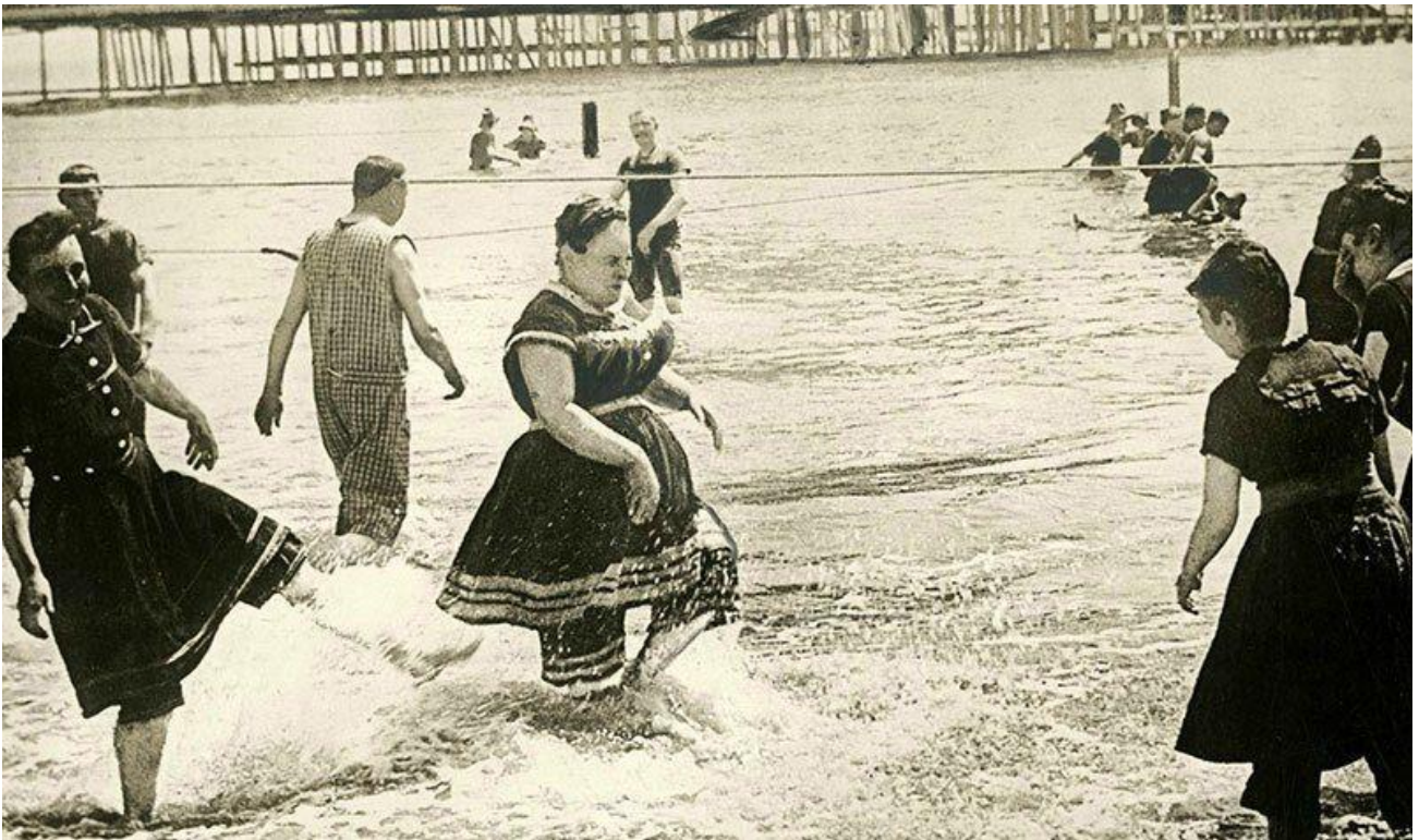
Kuva 19: Naisia rannalla 1800-luvun loppupuolella. ( www.victoriana.com )