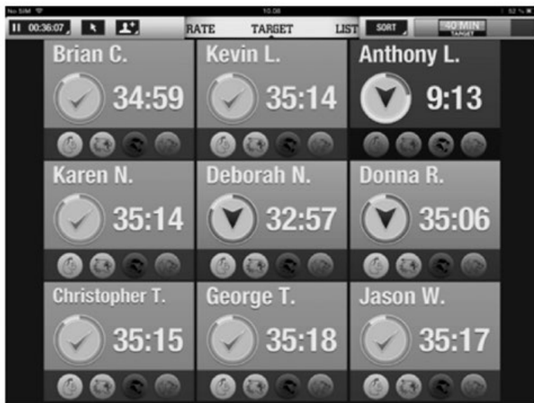
Kuva 2. Polar GoFit -sovelluksen tavoitenäkymä.

Kuva 2 on esimerkki PolarGoFit:in sykkeenseurantanaikymästä. Oppilaan nimen alla oleva pyöreä kenttä ilmaisee, onko oppilas tavoitesykealueella (vihreä) vai ei (punainen). Sen vieressä olevat numerot ilmaisevat puolestaan tavoitealueella vietetyn ajan minuutteina ja sekunteina. Alarivin pyöreät symbolit ovat saavutettuja merkkejä eli