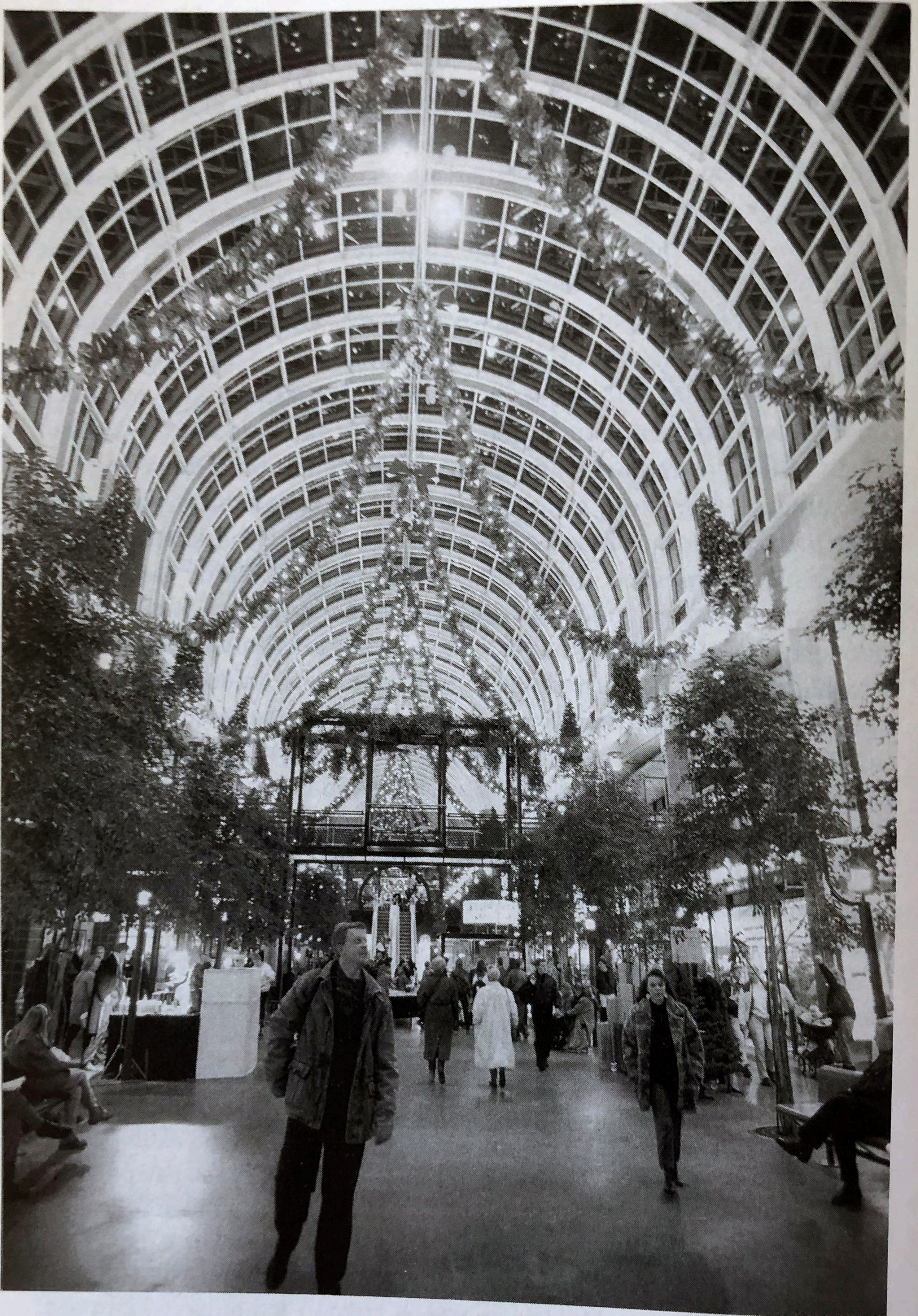
41. Kauppakeskukset ja hampurilaisravintolat — aikamme epäpaikkoja?