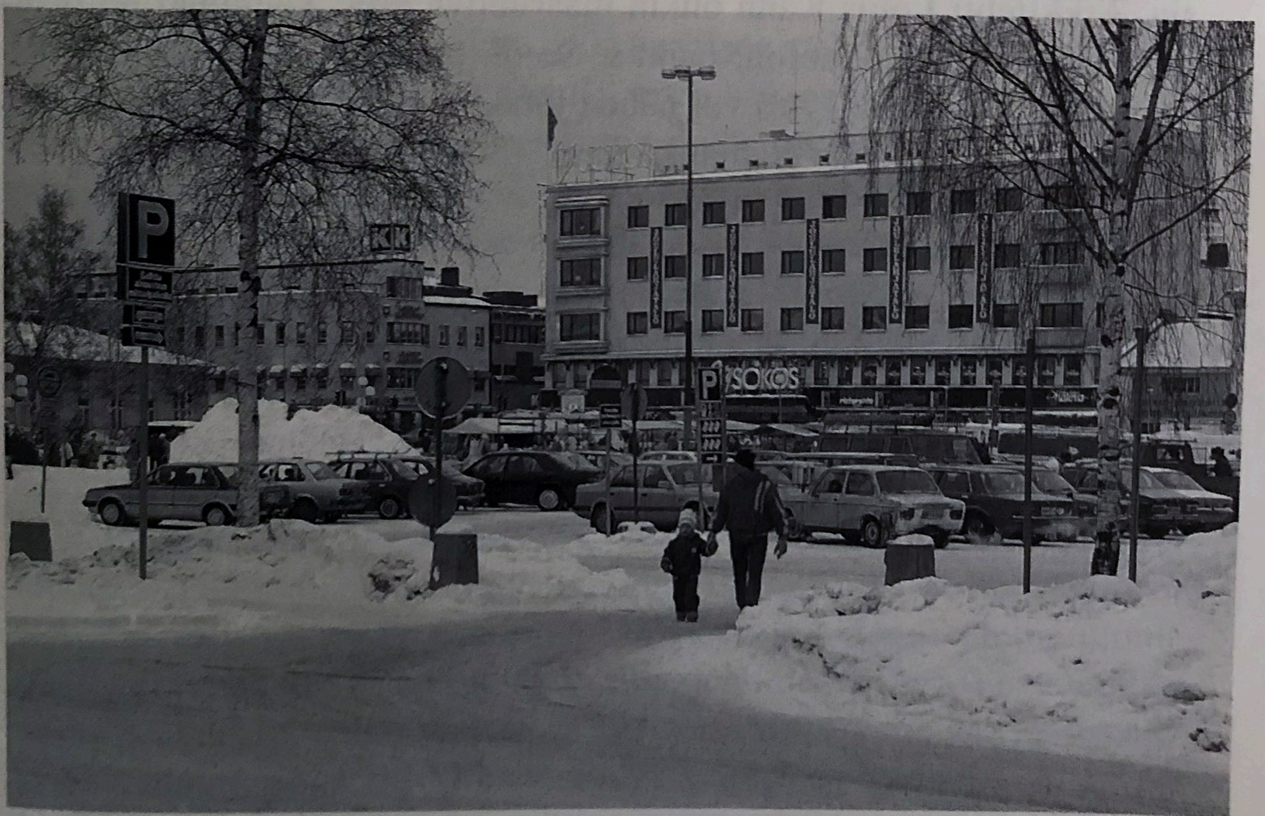
43. Paikan henkeä luovat ympäristön omaleimaisuus ja historian tuntu.