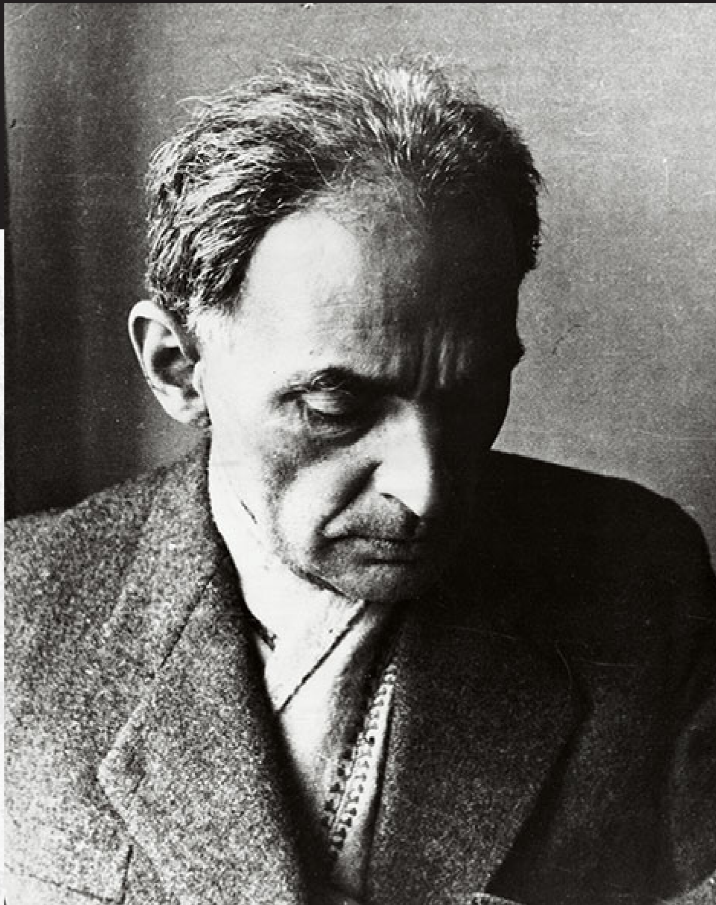
Dimitris Pikionis (1887-1968) 1900-luvun merkittävimpiä kreikkalaisia arkkitehteja