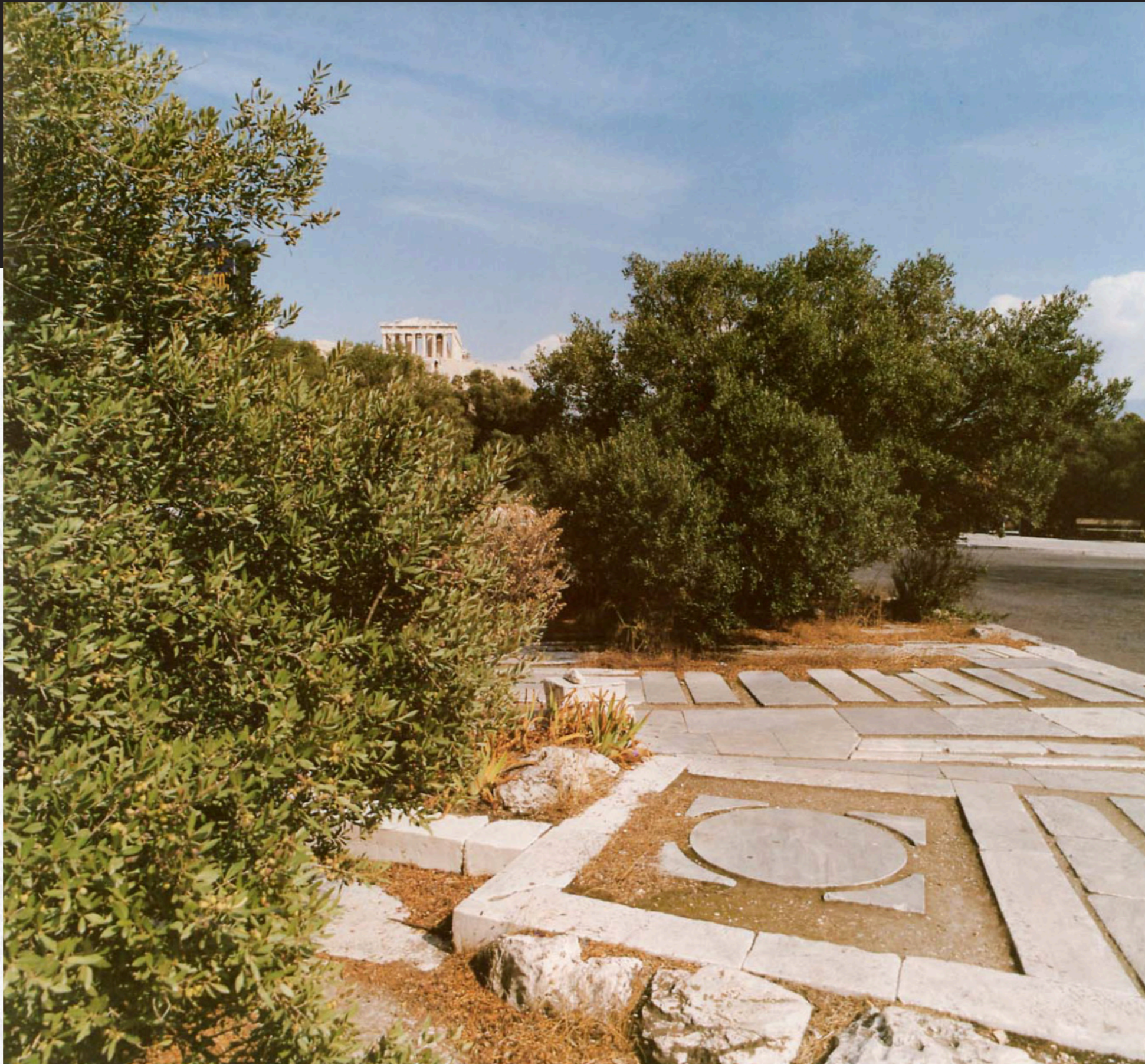
Akropolis- ja Filopappos-kukkuloiden ympäristö, Ateena 1954-58 Dimitris Pikionis (1887-1968)