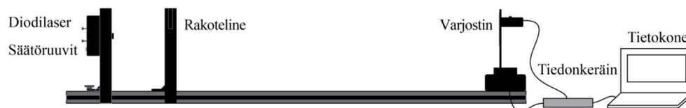
Kuva 2. Mittalaitteisto. Vasemmalla laser ja rakojärjestelmä ja oikealla varjostinlevy antureineen.

Mittalaitteisto (kuva 2) koostuu optisesta kiskosta, jonka toisessa päässä on punainen laser (aallonpituus \lambda=635 nm, maksimiteho alle 1 mW) ja sen edessä rakoteline ja toisessa päässä kiskoa vastaan kohtisuorassa suunnassa liikutettava varjostinlevy, jossa on valo- ja paikka-anturit. Rakotelineestä on valittavissa erilaisia rakojärjestelmiä, joiden läpi laservalo kulkee. Diffraktiokuvio voidaan havaita silmin varjostinlevyllä, mutta kuvion tarkkaa määrittämistä varten käytetään tietokoneeseen kytkettyjä antureita.