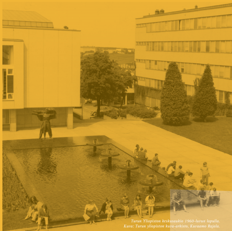
Turun Yliopiston keskusaukio 1960-luvun lopulla.

” Nykyajan tunnuksena ei enää ole ”puistoja kaupunkiin”, vaan ”kaupungit puistoihin”, ts. rakennukset luonnon piiriin. Siten sulautuvat pihat ja tonttialueet yhdessä viereisten rakentamattomien alueiden kera suureksi yhtenäiseksi puistokaupungiksi, missä ihminen ja luonto jälleen voivat löytää toisensa, niin että elämän raikkaus ja ilo voivat palata kaupunkiin, mistä suurkaupungistuminen jo oli ne melkein karkottanut. ” Otto-Iivari Meurman: Asemakaavaoppi (1947)