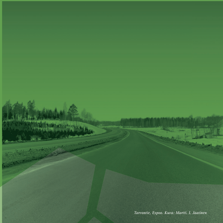
Tarvontie, Espoo.

Leena Iisakkila: Mikä on maisemasuunnittelija? – Arkkitehti uutiset 20/1976.