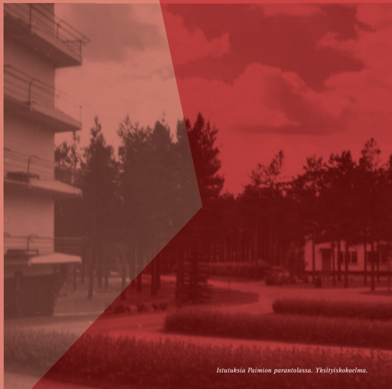
Istutuksia Paimion parantolassa. Yksityiskokielma.

"Nykyään yhtä yleisiä ovat pienviljelijäpuutarhat, omakotipuutarhat ja siirtolapuutarhat. --- Näemme siis, että puutarhat ovat seuranneet kehitystä ja uudet rakennustyypit ovat tuoneet mukanaan uusia puutarhatyyppejä."