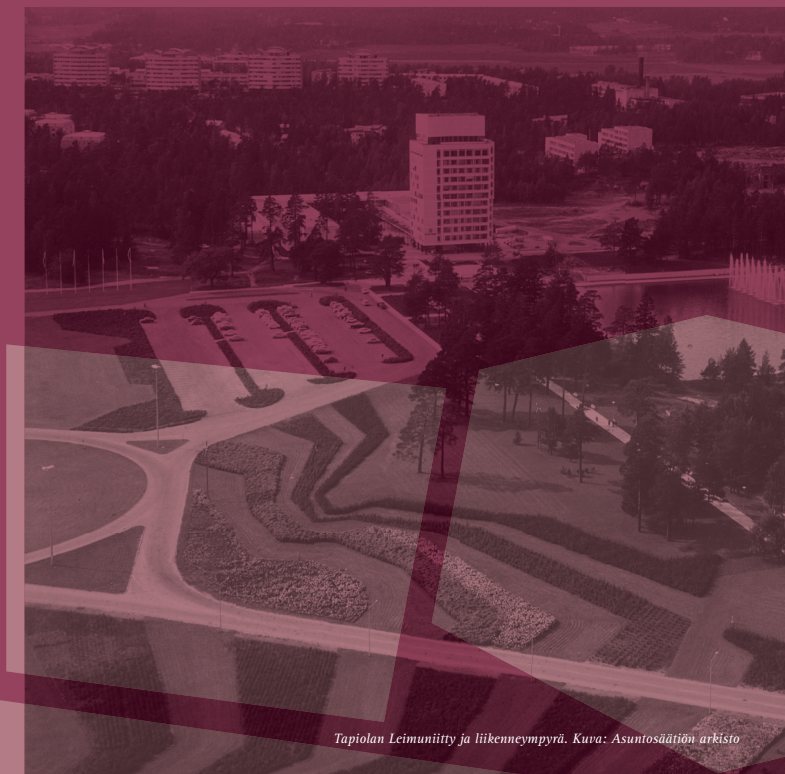
Tapiolan Leimuniitty ja liikenneympyrä.

Maisema-arkkitehtuurin muuttuvat ihanteet – tyylistä tyyliin vai irti tyyleistä?