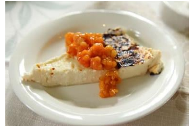
Making Leipajuusto Cheese at the Finnish Farmhouse - Eating Rules