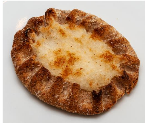
By Ralf Roletschek - Oma teos, GFDL 1.2, https://commons.wikimedia.org/w/index.php?curid=71958013