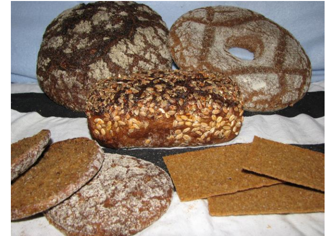
By Hellahulla (Hellahulla) - Oma teos, CC BY-SA 3.0, https://commons.wikimedia.org/w/index.php?curid=3061035