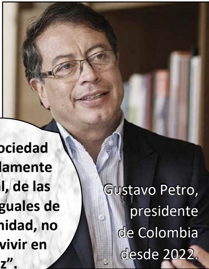
Gustavo Petro, presidente de Colombia desde 2022.

“Una sociedad profundamente desigual, de las más desiguales de la humanidad, no puede vivir en paz”.