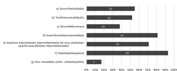
Mitä yhteistyökäytäntöjä kunnassa on käytössä? (n = 42)