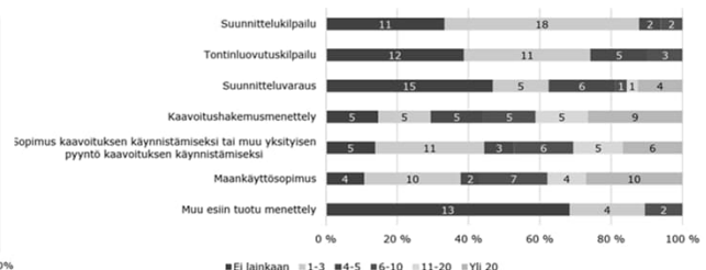
Kuinka monta kertaa yhteistyökäytäntöä on käytetty kunnassanne viimeisen 5 vuoden aikana? (n = 41)