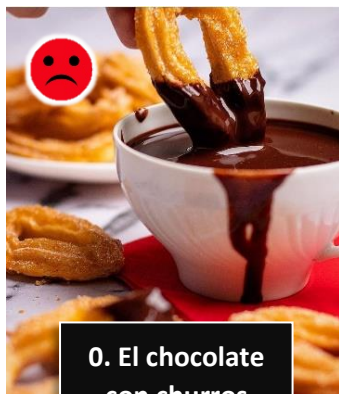
0. El chocolate con churros