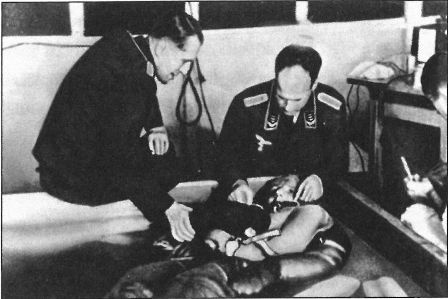
Figure 1: Inmates in Dachau Concentration Camp Subjected to a “Cold Water Immersion Experiment.” The experiment aimed to see if they could stay in freezing water for up to three hours. (On the left is Professor Ernst Holzlohner, and on his right is Dr. Sigmund Rasher.)