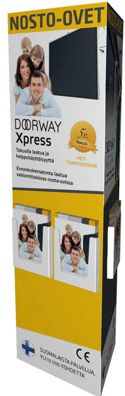
Valmis triangle torni