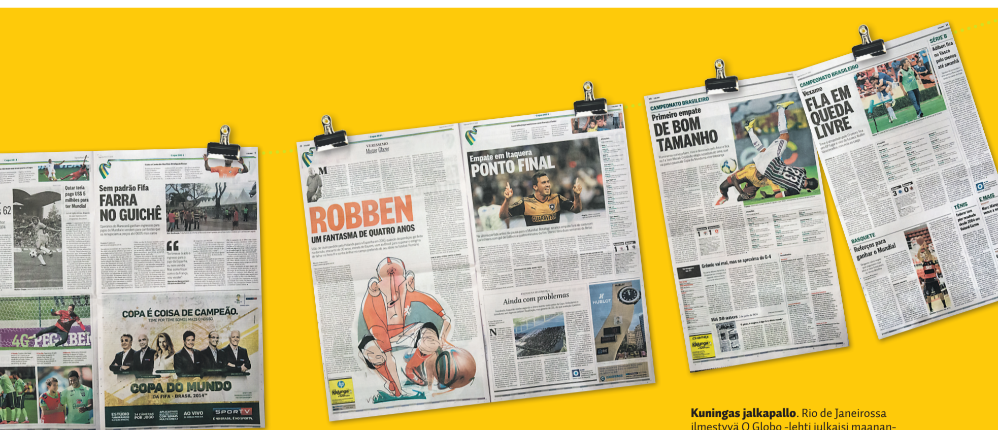
Kuningas jalkapallo. Rio de Janeirossa ilmestyvä O Globo -lehti julkaisi maanantaina 2.6. urheilusivujen sijaan MM-liitteen. Muulloinkin valtaosa lehtiä urheilu-sivuista on pyhitetty jalkapallopelle.

Brasiliassa pelatuissa ystävyysotteluissa kotityleisö puolestaan osoittautui paikoin niuhoksi, jopa vaativaksi. Se buuasi, jos joukkue ei voittanut murskaluvuin.