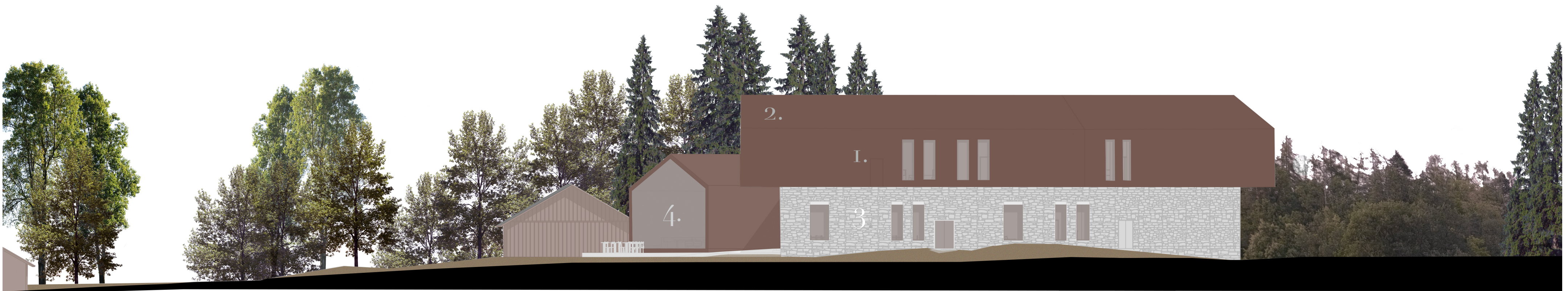
Julkisivu luoteen 1:200