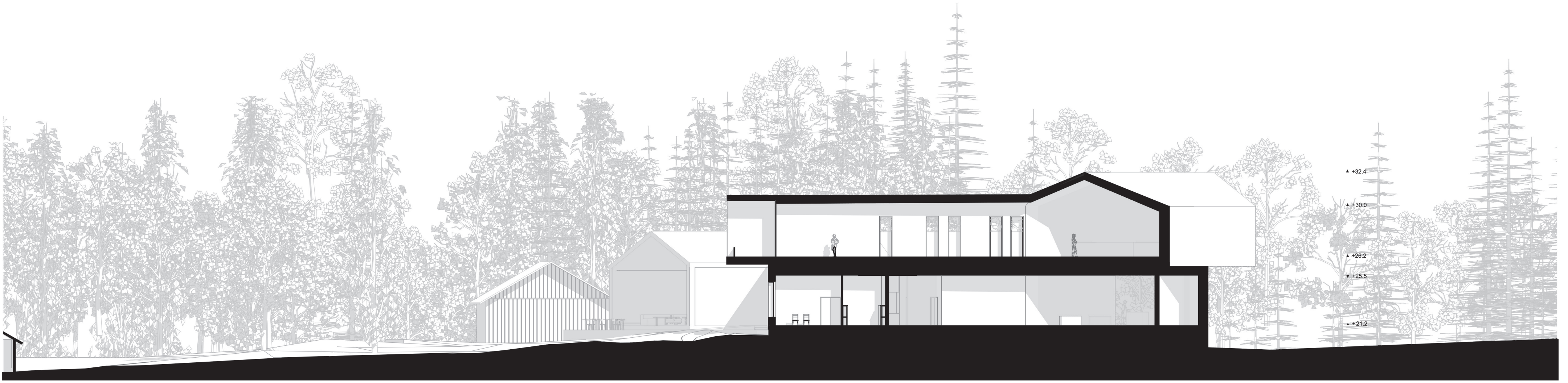
Leikkaus A-A 1:200