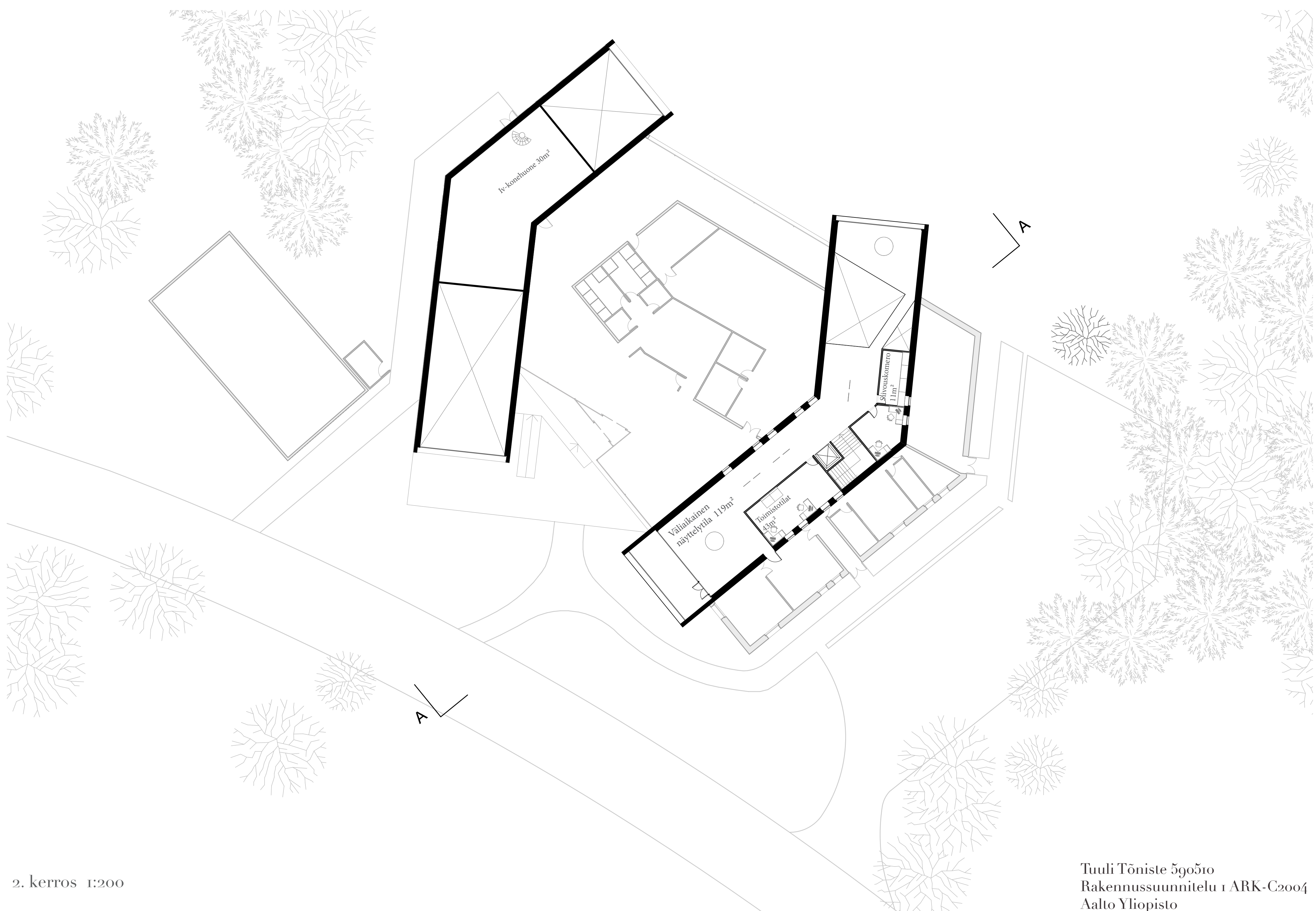
2. kerros 1:200