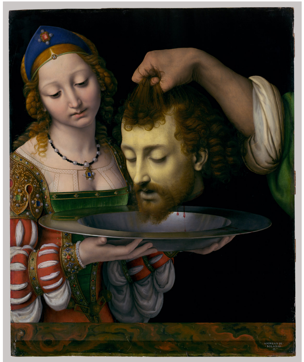
Salome with the head of St. John the Baptist. Andrea Solario, 1465-1524.